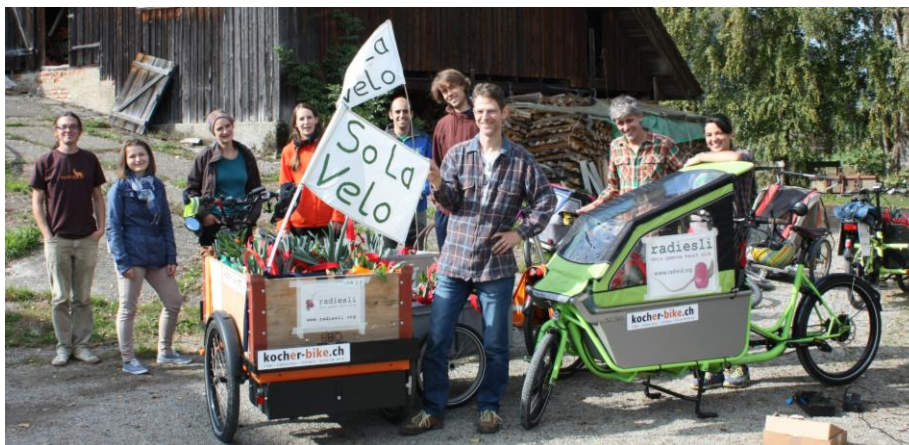
Abbildung 18: Sola-Velo Lieferung (r, Frühling 2015)

„Heute ist kein Auto fürs radiesli gefahren!“, meinte ein SoLa-Velo Mitfahrer, als wir uns nach der Lieferung der Gemüsetaschen per Fahrrad in der Stadt zu einem Bier treffen. Dafür hätte sich der zeitliche Aufwand doch gelohnt (r, 20.5.16).