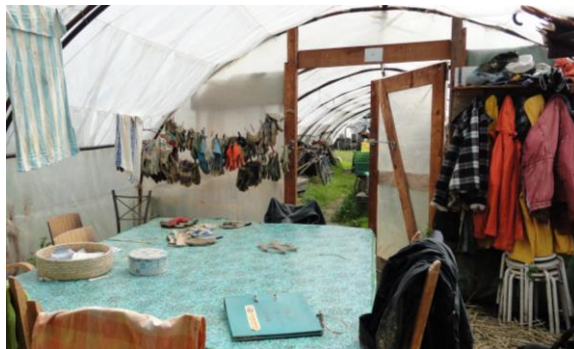
Abbildung 8: Das Buch der Selbstkontrolle im Gemeinschaftsraum, (CdCh, 30.6.16)