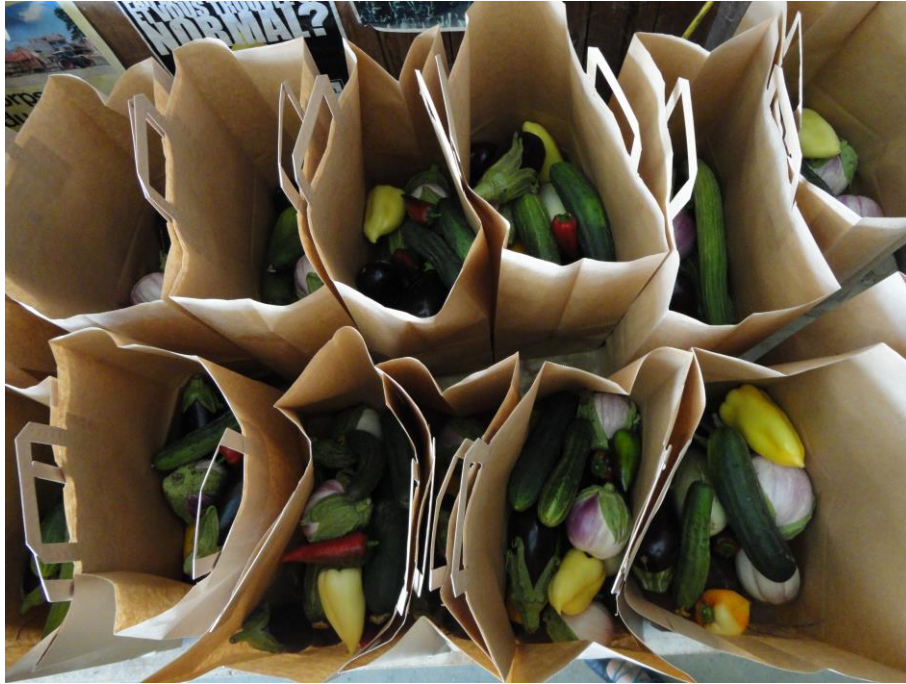
Abbildung 22: Abgefüllte Gemüsetaschen (LCh, 4.8.16)

Mehr Autonomie im Sinne von Illich (1986) kann auch über Kreislaufnetzwerke mit anderen RVL-Initiativen derselben Region entstehen, die unter sich die Produktionsschritte aufteilen. Ein gutes Beispiel dafür ist die Zusammenarbeit in Genf: Die Genossenschaft Les Charrotons liefert Gemüse zur Saatgutzüchtung und -vermehrung an den Verein Semences de Pays, welcher die Samen an den Verein Les Artichauts weiterverkauft, wo sie zu Setzlingen angezogen werden, die dann schliesslich wieder an die Genossenschaft Les Charrotons verkauft werden.