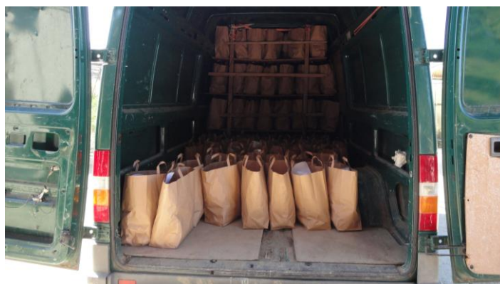
Abbildung 19: Lieferung der Gemüsetaschen per Lieferwagen (LCh, 4.8.16)

Beim Verein radiesli liefern ungefähr einmal pro Monat 5-10 Mitglieder die Gemüsetaschen per Fahrrad und Anhänger aus (siehe Abb. 18). Neben dem ökologischen Aspekt (weniger CO 2 -Ausstoss), zählen vor allem der Spassfaktor und das Zusammensein, wie mir die MitfahrerInnen erklärten (r, 20.5.16). Ansonsten liefern sie wie die beiden Genossenschaften Les Carrotons und La Clef des Champs die Taschen mit Privatfahrzeugen (siehe Abb. 19) aus, da eine regelmässige Lieferung per Fahrrad einen zu grossen zeitlichen Aufwand darstellt.