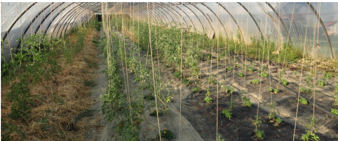
Abbildung 16: Gemüsetunnel mit Tomatenbeeten, als Versuch sind die äusseren Beete nach dem Prinzip der Permakultur mit einem Mulch aus Stroh gedeckt (CdCh, 30.6.16)