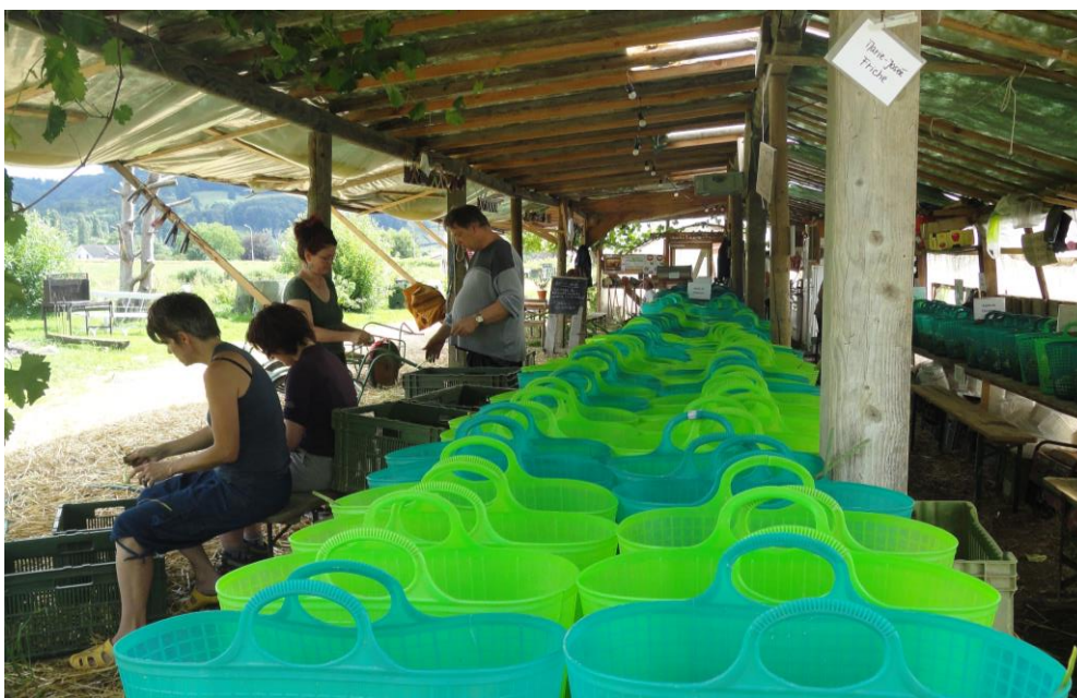
Abbildung 3: GenossenschaftlerInnen beim Vorbereiten der Gemüsetaschen