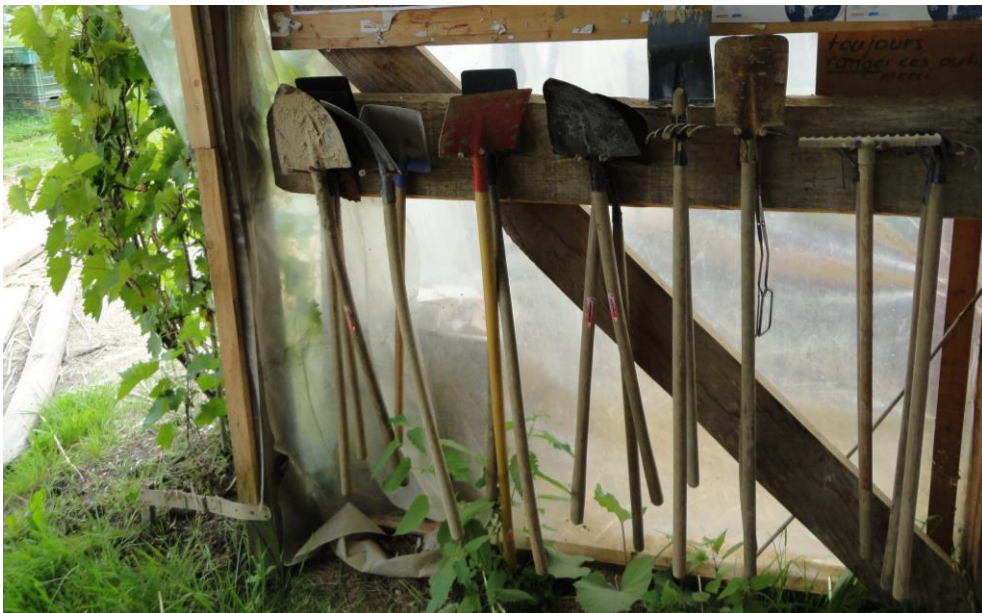
Abbildung 21: Kollektive Produktionsmittel für kleine Mitarbeitende (CdCh, 13.5.16)