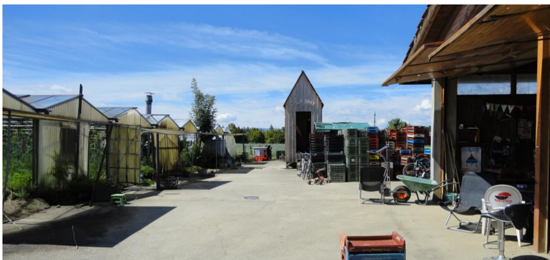
Abbildung 4: Hangar (rechts) der Genossenschaft Les Charrotons mit den Gewächshäusern (links) und der Komposttoilette mit der Beschriftung „Holy Shit“ in der Mitte des Vorplatzes (11.8.16)

Les Charrotons ist eine RVL-Genossenschaft ohne Erwerbszweck, deren Organe die GV und der Vorstand, bestehend aus mindestens 5 GenossenschaftlerInnen, bilden. Ihre Mitglieder können jeweils dienstags, mittwochs oder samstags die vier vorgesehenen Halbtage Mitarbeit pro Jahr absolvieren. Am Dienstag wird geerntet, am Mittwoch wird verpackt und geliefert und am Samstag stehen allgemeine Gartenarbeiten an. Die rund 140 Gemüsetaschen werden wöchentlich