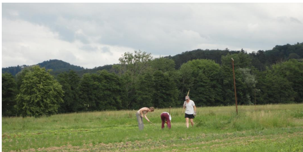
Abbildung 13: Trotz den kühlen Temperaturen im Mai kommt man bei der Feldarbeit ins Schwitzen (CdCh, 13.5.16)