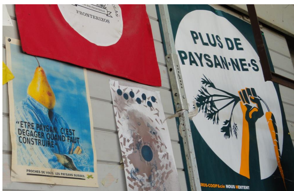
Abbildung 6: Das Plakate mit der Beschriftung „Bauer sein bedeutet, Platz machen, wenn gebaut wird“ spiegelt den selbstironischen Umgang Der GenossenschaftlerInnen mit der politischen Ausgangslage ihrer Genossenschaft wieder (LCh 6.8.16)

Bei den letzten Feldbesuchen im Herbst überprüfte ich nochmals meine Theorie und nahm vom Feld und den Forschungsmitgliedern vorübergehend Abschied. Dies war nicht so einfach, da mir die Menschen mit ihren Anliegen, Wertevorstellungen und Bemühungen sehr ans Herz gewachsen waren. Zudem haben die Felddaufenthalte und der Forschungsprozess meine eigenen „Sinneswelten“ verändert, im Sinne einer dialektischen Wechselbeziehung zwischen dem Feld und mir. Ich bin auf die lokale, saisonale und biologische Lebensmittelproduktion sowie auf zwischenmenschliche und gesellschaftspolitische Herausforderungen für landwirtschaftlichen Genossenschaften oder Vereine in der Schweiz sensibilisiert worden. Meine finale Theorie verstehe ich als ein subjektiv geprägtes Produkt, das ich dank den Begegnungen im Feld und meiner „inneren Beteiligung“ und Kreativität erstellen konnte.