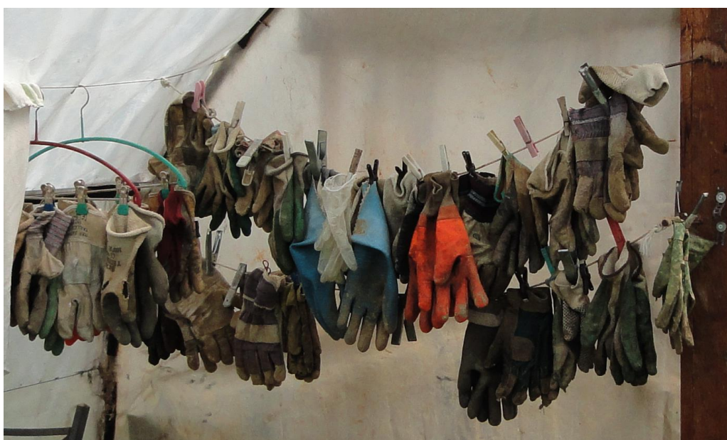
Abbildung 24: Kollektive Arbeitskleider in allen Grössen (CdCh, 13.5.16)

Aufbauend auf die zwei ersten Grundthesen, ergibt sich die dritte Grundthese, die besagt, dass aus einem Zusammenwirken der drei Bedeutungszuschreibungen die Mitarbeit für die Mitglieder einer partizipativen RVL grundsätzlich eine räumlich-zeitlich (wieder)verankernde sowie sozial bindende Wirkung erlangen kann.