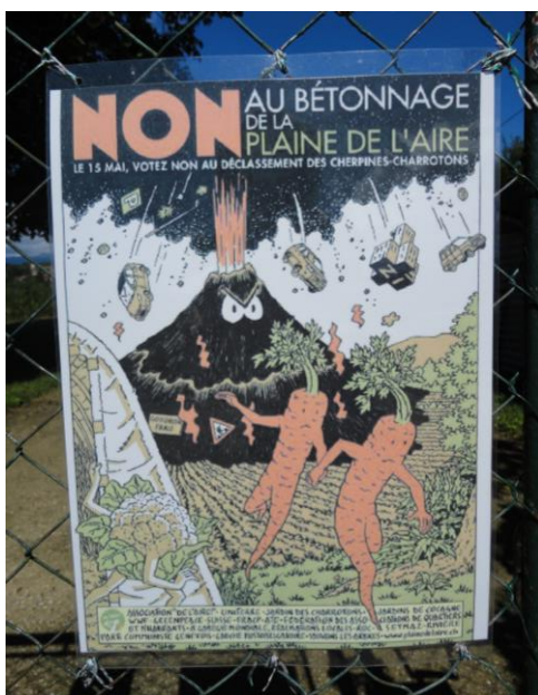
Abbildung 5: Plakat der InitiantInnen des Referendums gegen den kantonalen Bauplan des Quartiers Les Cherpines (LCh, 6.8.16)

Als Ersatz bot das kantonale Landwirtschaftsamt der Genossenschaft am anderen Ende der Stadt Genf ein Grundstück an, wo jedoch keine Infrastruktur für die Unterkunft der GemüsegärtnerInnen vorhanden gewesen wäre und der Boden nach ihren Analysen für Gemüseanbau nicht geeignet ist. Nach längeren Aushandlungsprozessen mit den Behörden entschlossen sich die GemüsegärtnerInnen Ende September 2016, das Angebot abzulehnen. Die Gründe seien verschiedene gewesen. Ausschlaggebend war die Position des Kantons als Eigentümer, das Land nicht an die Genossenschaft, sondern nur auf den Namen einer Person mit landwirtschaftlicher Ausbildung zu verpachten. Da die GemüsegärtnerInnen nicht vom Prinzip der kollektiven Autonomie (siehe Kapitel 5.3) ablassen wollten, haben sie schliesslich abgelehnt, was das Ende der Genossenschaft Les Charrotons bedeutete.