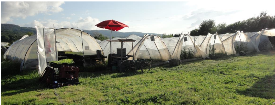
Abbildung 14: Geöffnete Gemüsetunnels (CdCh, 30.6.16)

Während den Feldaufenthalten ging ich unter anderem der Frage nach, welche Form von Landwirtschaft von den Mitgliedern als wünschenswert erachtet wird. Grundsätzlich konnte ich feststellen, dass bei allen drei Initiativen nach den Richtlinien des biologischen Landbaus (Bio-Suisse 2017) gearbeitet wird. Wie bereits erwähnt (siehe Kapitel 5.1), spielt die offizielle Zertifizierung durch das Schweizer Bio-Knospen-Label für die meisten Mitglieder eine geringe Rolle, da Vertrauen über den Prozess der partizipativen Kontrolle und der Kopräsenz der Mitglieder geschaffen wird.