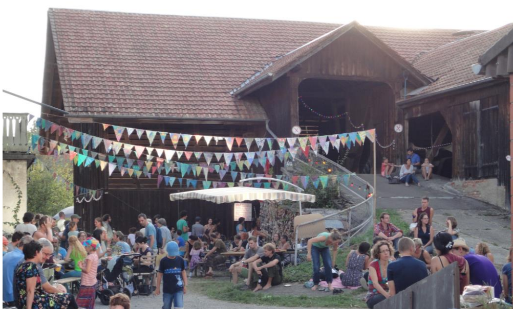
Abbildung 2: Hoffest des Vereins radiesli und der GmbH radiesli (3.9.16) 11

Das Gemüsefeld des Vereins radiesli befindet sich in der Peripherie des Dorfs Worb im Worbital (Kanton Bern), wo die Industrie- und Siedlungszone an die umliegende Landwirtschaftszone grenzt. Seit dem Jahr 2011 verpachtet ein dort wohnhaftes Bauernhepaar 0,6ha Land an den Verein radiesli, auf dem vorher Erdbeeren nach dem Prinzip des Selberpflückens angebaut wurden. Der ehemalige Schweinestall neben dem Gemüsefeld diente dem Verein während der letzten fünf Jahre als Abpack-, Lager-, Koch-, und bei schlechtem Wetter als Essraum.