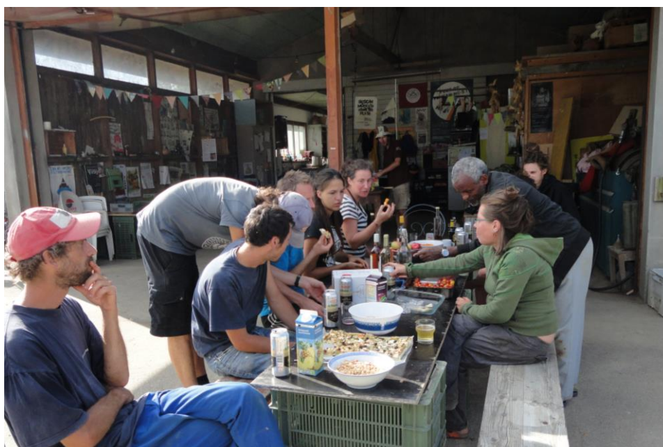
Abbildung 9: Konvivialer Apéro zum Abschied einer Praktikantin (LCh, 11.8.16)

Zudem ist die Stimmung während den Feldarbeiten und den Essenspausen für die Gemeinschaftsbildung sehr wichtig (siehe Abb. 9). Wie es Beat (r, 6.7.16) erklärte, würde er nicht aufs Gemüsefeld gehen, wenn er dort alleine wäre. Er findet es schön, gemeinsam etwas zu erarbeiten, ohne dabei unter Zeitdruck zu stehen. Da es sich bei der Mitarbeit nicht um professionell entlohnte Arbeit, sondern um eine freiwillig gewählte Aktivität handelt, wird das Arbeitsklima von den Mitgliedern grundsätzlich als entspannt und nicht auf Effizienz ausgerichtet wahrgenommen.