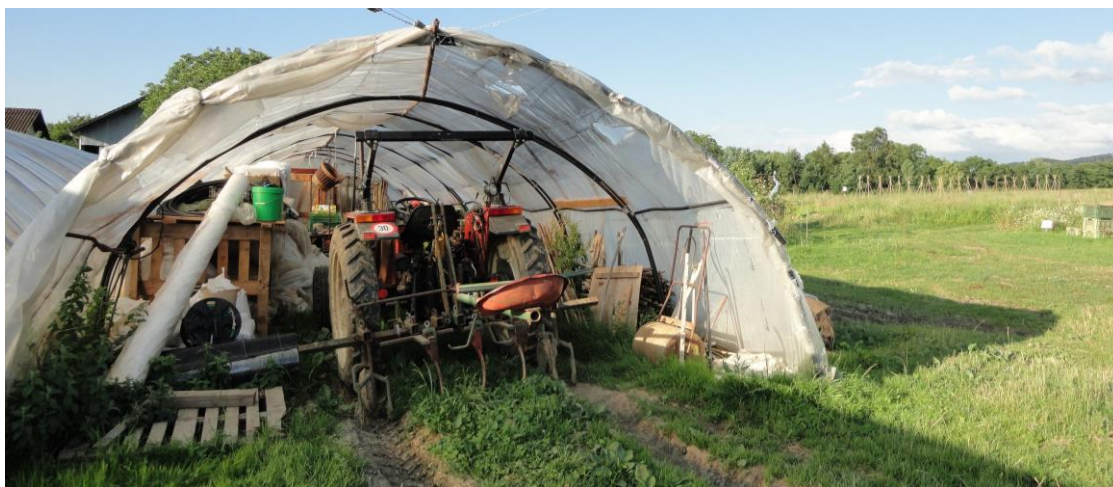
Abbildung 17: Traktor der Genossenschaft La Clef des Champs, der hauptsächlich zum Pflügen benutzt wird (30.6.16)

Beim Essen diskutieren sie über eine mögliche Umstellung auf eine fossilfreie Landwirtschaft. Es wäre eigentlich ganz einfach, meint Mathias der junge Gemüsegärtner, ausser die Plastiktunnels, die seien schwer ersetzbar. Das Lagergemüse könnte man wie früher in einem Loch in der Erde aufbewahren. Nur leider sei der Boden dafür hier zu nass. Daher würden sich wahrscheinlich die Gemüsekelter besser eigenen (CdCh, 14.5.16).