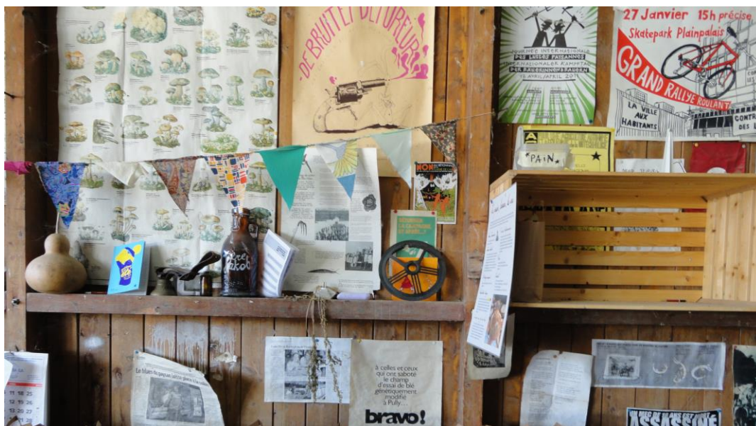
Abbildung 20: Plakate von vergangenen Demonstrationen für KleinbäuerInnen, HausbesetzerInnen oder mehr Fahrradwege in Genf (4.6.16)

der Genossenschaft Les Charrotons gut zum Ausdruck, wo verschiedene Plakate die lokalen bis internationalen Demonstrationen der Kleinbauernbewegung der letzten zehn Jahre illustrieren und in Erinnerung behalten (siehe Abb. 6 und 20).