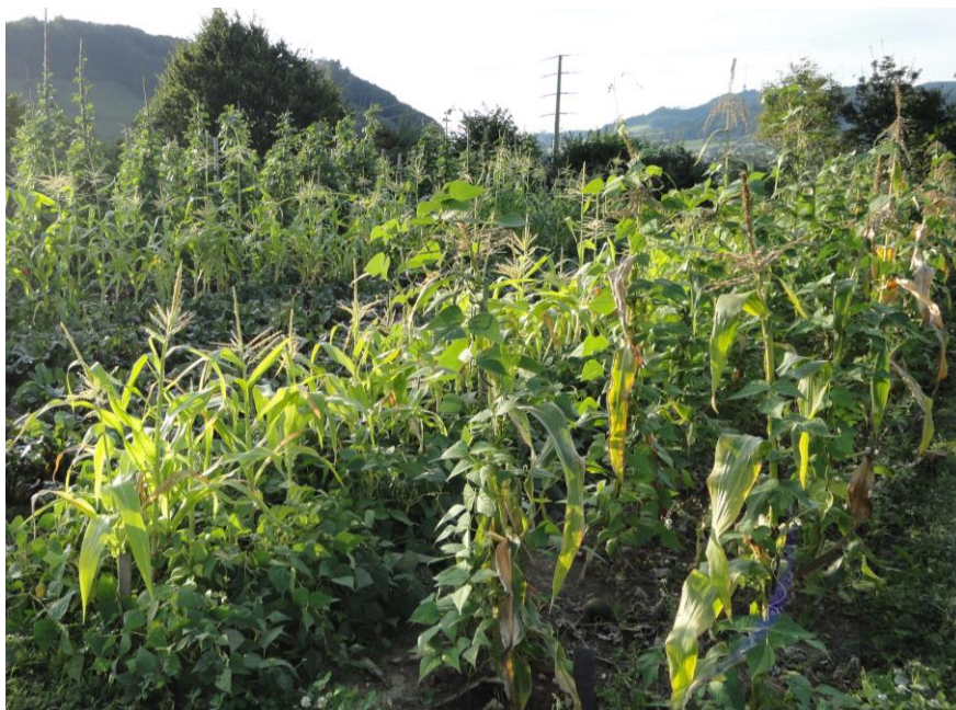
Abbildung 15: Eine in der Permakultur viel praktizierte Pflanzenkombination von Bohnen und Mais (r, 3.9.16)

Mischung von traditionellem landwirtschaftlichem Savoir-Faire mit wissenschaftlichen Erkenntnissen baut die Permakulturbewegung auf den biologischen Anbaupraktiken auf.