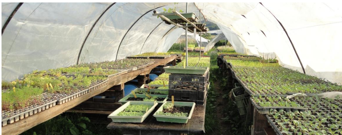
Abbildung 12: Setzlinge im Treibhaustunnel